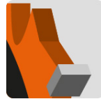
Dientes de carburo