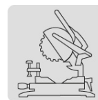
Para sierra de inglete