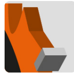
Dientes de carburo