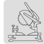
Para sierra de inglete