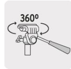
Base con giro horizontal