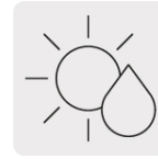
Para cortes en seco y húmedo