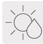
Para cortes en seco y húmedo