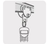
Oreja de acero