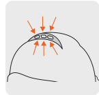
Ranuras de ventilación en la parte superior del casco