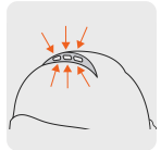
Ranuras de ventilación en la parte superior del casco