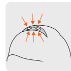
Ranuras de ventilación en la parte superior del casco