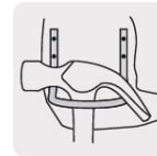
Gancho de acero para martillo