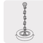
Cadena para sujetar cinta