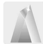
Dientes con triple filo