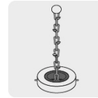
Cadena para sujetar cinta