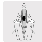
Para rajar madera