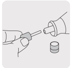
Fácil intercambio de accesorios