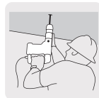
Mango tipo "D"