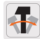
Cincel + ángulo ajustable