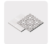
Loseta y cerámica