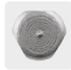
Zanco P3 antiderrapantes