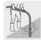
Para compactar el concreto