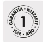
GARANTÍA • WARRANTY • YEAR • AÑO