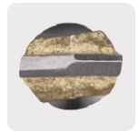
Punta de carburo de tungsteno