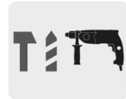
Para rotomartillos SDS Plus