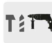
Para rotomartillos SDS Plus