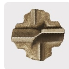
Punta de cruz