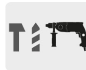
Para rotomartillos SDS Plus