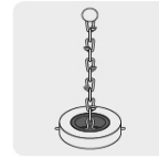
Cadena para sujetar cinta