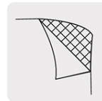
Respaldo de tela