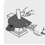
Forjados en una sola pieza