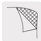
Respaldo de tela