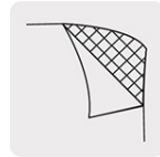
Respaldo de tela