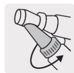
Flujo de pintura