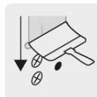
Cubrir tornillos y huecos