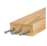
Madera con clavos hasta 3/16" (5mm)