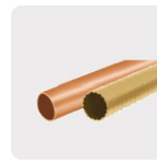
Metales no ferrosos (cobre y latón)