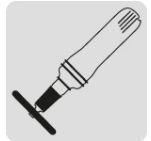
Para esmeril neumático recto (DICOF-3010)