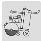
Cortadora de piso