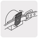
Clip de palanca para mejor sujeción