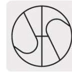
Punta Split Point