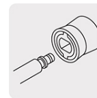
Sistema de conexión rápida