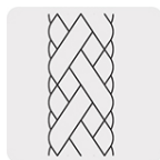
Manguera de alta presión