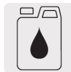
Incluye aceite multigrado SAE-10W30