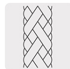
Manguera de alta presión