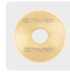
Cuchillas con recubrimiento de titanio