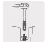
Inserto de neopreno