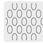
Malla al reverso