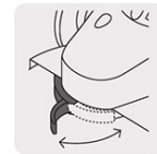
Guarda de ajuste rápido