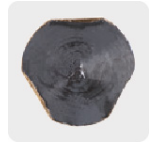
Zanco P3 antiderrapante