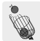
Garra para recolección de frutos