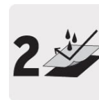
Capa de material PVC / Poliéster