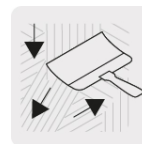
Acabados de pared