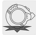
Resistente a impactos